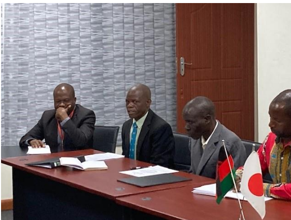
チリンディザ校長スピーチ