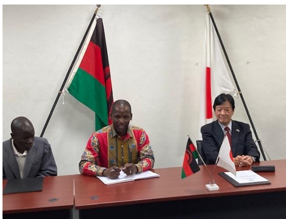
教育省マジ教育局長スピーチ