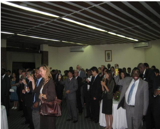
乾杯の様子（ゲストの方々）