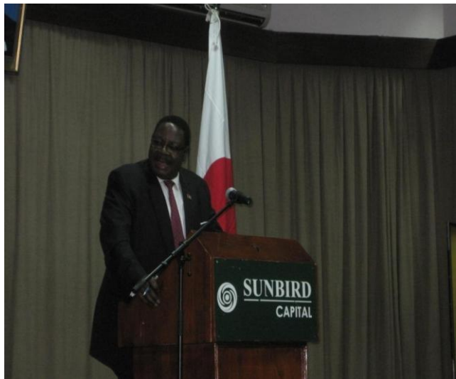
ムタリカ外務大臣によるスピーチ